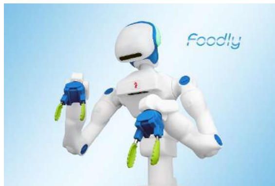
▲人型協働ロボットFoodly